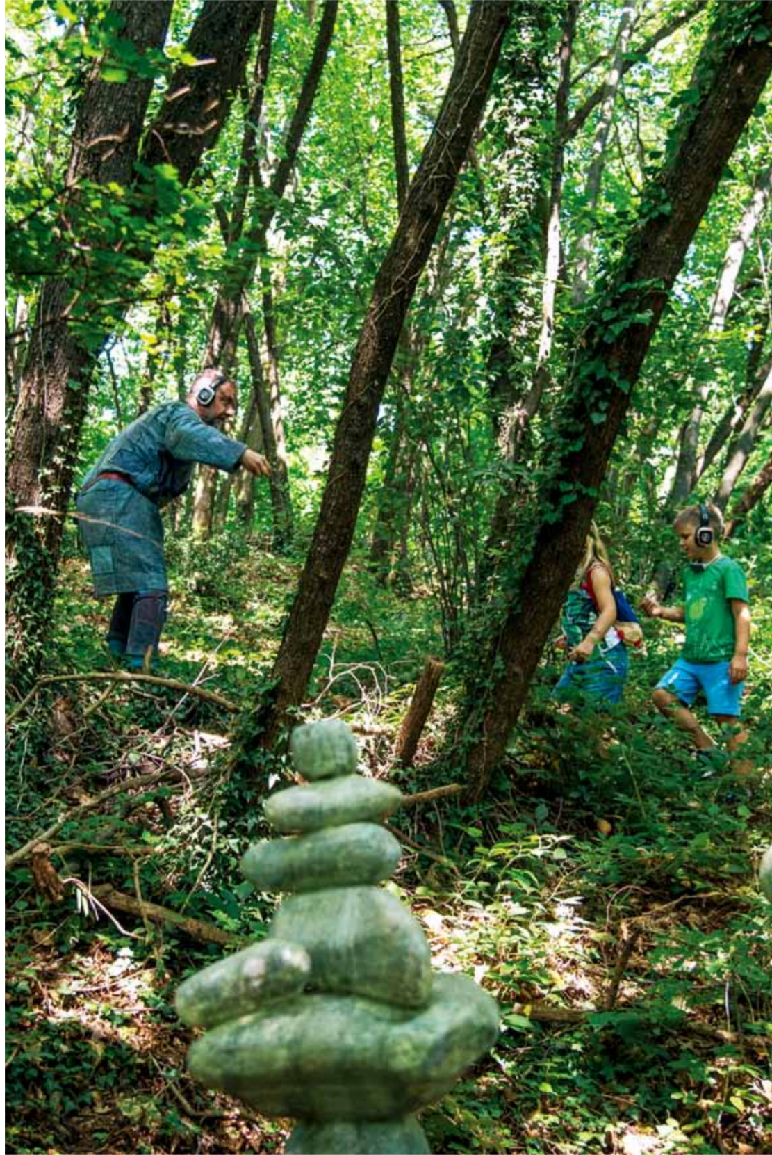
孩子们走在森林中，一起观看演出，摄影：Alvise Crovato