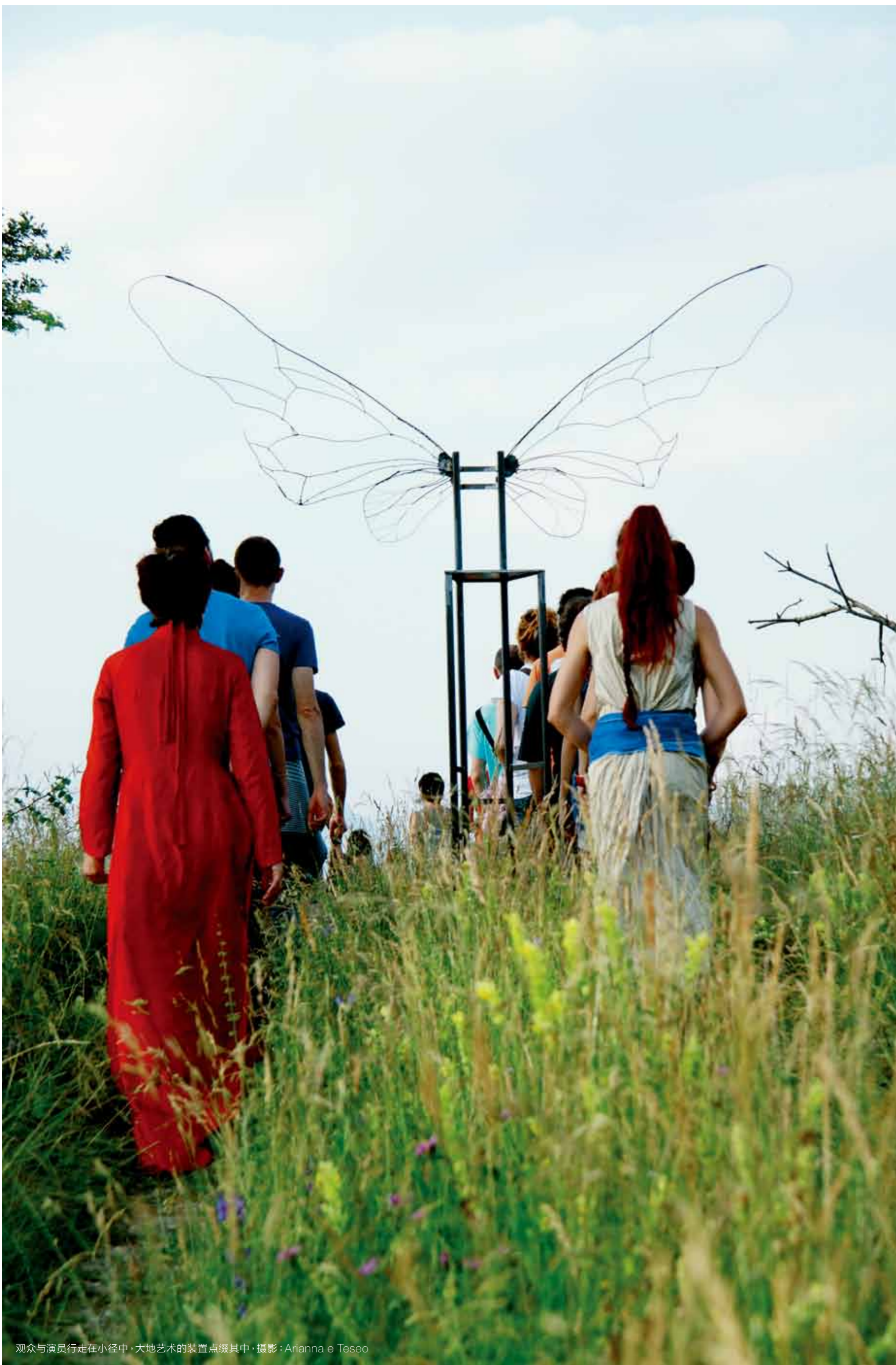
观众与演员行走小径中，大地艺术的装置点缀其中，摄影：Arianna e Teseo

走着走着，一棵树下荡着秋千的人突然吹起了笛子，观众停下来，他看着我们，念起一首诗，像是树上的精灵。