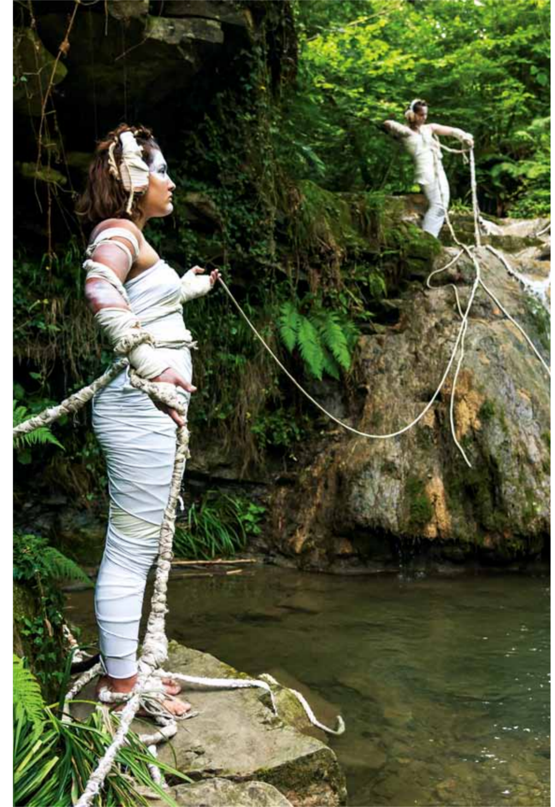
溪水中的希腊神话克里特公主Ariadne帮助忒修斯杀死了半牛半人的妖怪弥诺陶洛斯