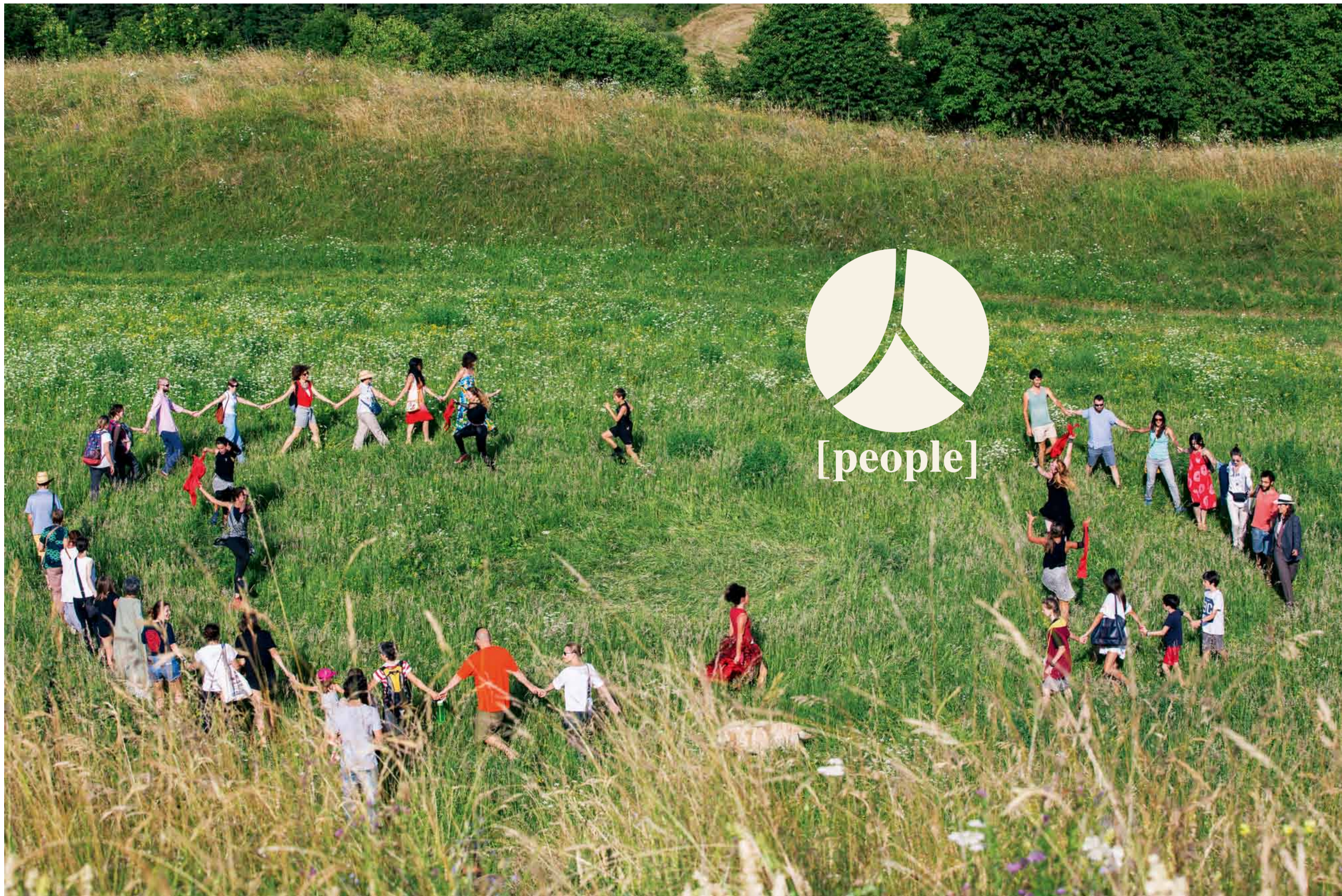
行至山谷·戏剧演员以古希腊神话《奥德赛》的故事·拉起观众的手·一起参与舞蹈·摄影：尔尼